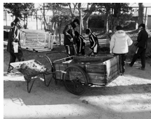
グラウンドの自主改修

最後にもう一つ、好成绩の一因と感じたことを挙げておきます。それは、自分たちの手によるグラウンド改修です。グラウンドの南側に側溝があるのですが、長い年月の間に手前のところが盛り上がり排水機能を失ってしまっています。そのせいで、雨上がりのグラウンド状態はひどいものさうです。そこで練習後に自分たちの手で盛り上がった側溝手前の土を掘り起こして運び、側溝と同じ高さにしようと作業していたのです。自分たちのことは自分たちの手でという選手たちの自主性と先生方の熱心な指導が相まって、北部中はいつその活躍を遂げていくことなのでしょう。そう思いつつ、私はグラウンドを後にしました。