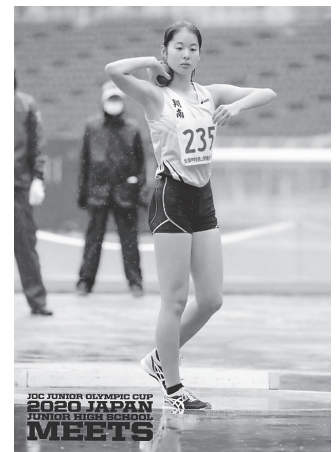
日本中学記録達成時の写真