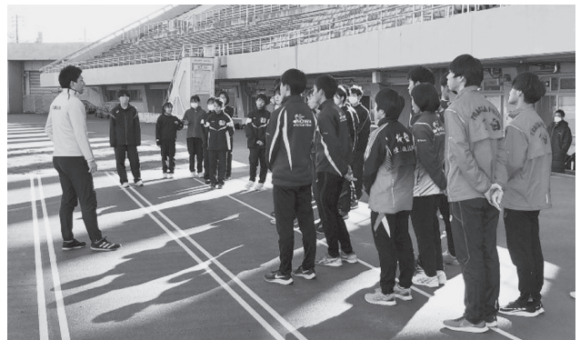
1月10日 パロマ瑞穂にて