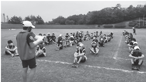
運動能力向上プロジェクト