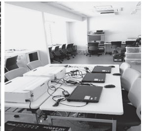
写真判定・記録情報室

場の名称も「岡崎龍北総合運動場」となりました。直走路9レーンの全天候型の第3種陸上競技場で、電子機器も用意され、スタート音は電子音を採用しています。簡単な照明施設もあり、夜間の使用も可能です。直走路のスタート付近とゴール付近の照度は十分に確保され、写真判定装置の使用も可能となっています。また、300mHのポイントも設置されています。オープン当初から利用者数も多く、小中高生の練習のみでなく、勤務を終えた方々の夜間練習や、クラブチームの練習会場として、活気あるものとなっています。