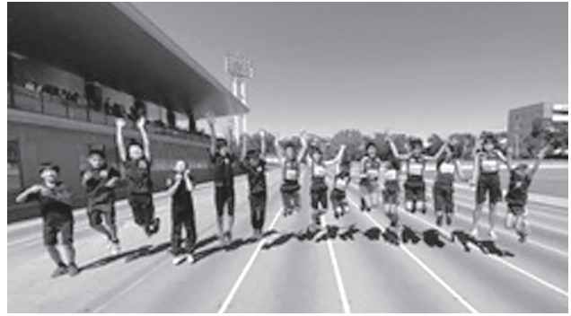
チーム皆仲良しです