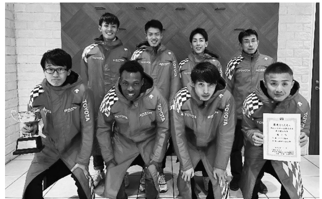
男子：トヨタ自動車

一方、1月に前橋で行なわれた全日本実業団男子駅伝（ニューイヤー駅伝）では、トヨタ自動車が2年連続の準優勝となりました。男女とも、来年こそ優勝していただきたいと思います。