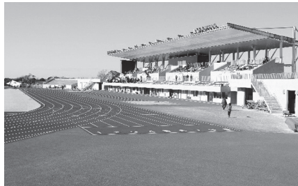
龍北スタジアムグラウンド

2020年7月5日に、「岡崎龍北総合運動場」(旧「愛知県岡崎総合運動場」)が、オープンしました。PFI事業*で県営競技場が、建設から運営まで民間事業化されました。全施設が作り替えられ、陸上競技