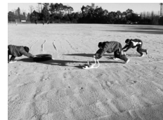
砂浜?トレーニング

サーキットトレーニングの中で印象に残ったことを3点挙げておきます。1点目は、グラウンドの状態です。陸上部が主に使用しているあたりは、厚さが5センチほどでしょうか、表面が砂の層になってしまっています。走りにくいだろうなと思って先生にお話をすると、「ここでスパイクを履かせる意味が分からないぐらいです」とおっしゃっていました。しかし、タイヤ押しやパワースレッダー押しの様子を見てみると、この砂の層が逆に有効に働いているなと思いました。器具を動かすのに大きな負荷がかかります。その分強化が上積みされるのです。この点については、「砂浜トレーニングをしているようなものですよ」と先生はおっしゃっていました。