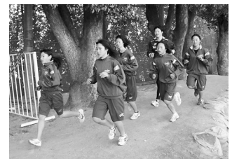
負荷のかかる坂道走路