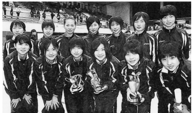
県最高記録で4年連続入賞の愛知県チーム