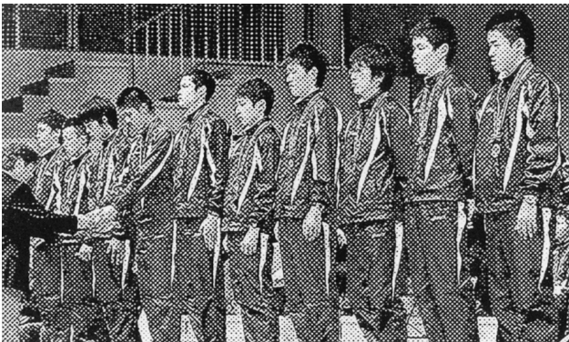
都道府県駅伝総合3位の愛知県チーム