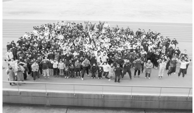
平成24年度尾張陸協陸上教室・閉会式

今シーズンの話題として2つ挙げたい。一点めは登録者の増加である。既報のように経年比較でH20年度を100とした場合の伸び率を掲載したが、さらに平成24年度は一般登録者数246名→409名(165)、高校登録者数1130名→1480(131)とここ3年で急増している。二点めは陸上教室での指導スタッフの増員及び参加者増である。昨年度は年3回開催+任意の開催1回であったが、今年度からは4回開催とした。HPに開催要項をアップし、指導者の方にも事前にアンケートをして教室への参加を呼びかけ、事前登録者が70名を越す陣容になった。4回の指導人員の延べ人数は事務方、サポートスタッフを入れて200名を超えた。また参加者も当日参加を加えて2000人超をカウントした。この結果は様々な要因が考えられるが、世の中の流れつまりはブームである。そして競技場の改修、オリンピックイヤー。加えて指導者の熱意と子供たちの満足感、達成感、次のステップへの渴望感である。これらの要因がうまく絡んでの結果であろう。そして保護者の意識の高まりも大切な要素だ。今後も一つ一つを大切にしていきたい。