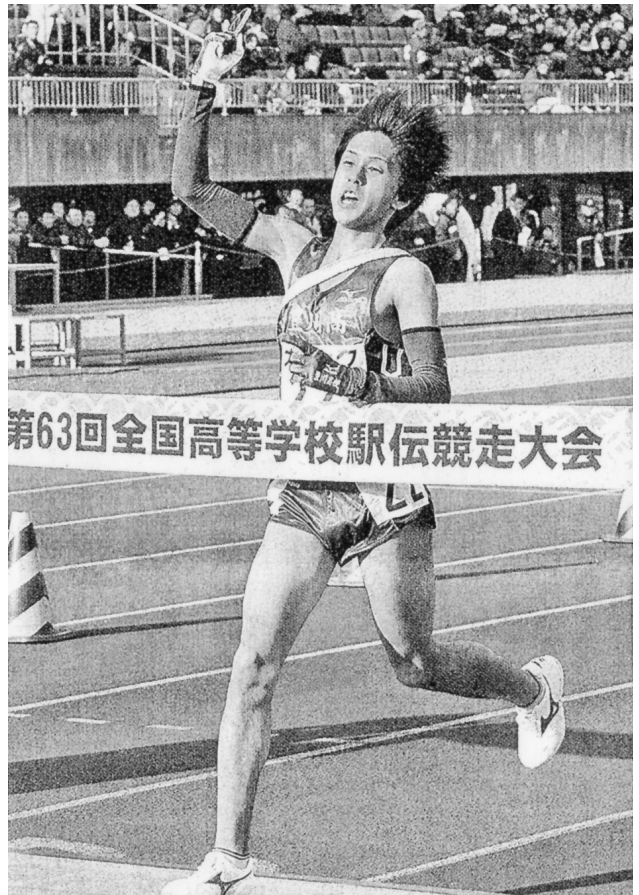
初出場初Vの豊川高校