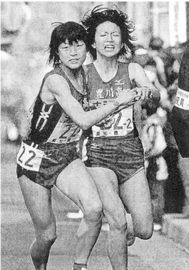
全国高校駅伝準優勝の豊川高校 2区から3区へ