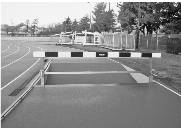
新設の大障害の水濠