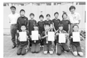
小学生リレー大会出場者

また、通常練習は土曜日を基本としています。成岩 SC 陸上練習する半田運動公園陸上競技場にはナイター設備があり、平日の月曜日から木曜日は21時まで練習することができます。40mの雨天走路が2箇所あって、天候に関わらず日常の練習場所として利用しています。そのため、子どもたちは平日にも自主練習を行なっています。会員が通う成岩中学校には陸上部が無いため、小学校で活動していた会員のうち、一部の熱心な子は中学校で部活動を行わず、成岩 SC 陸上で活動を続けています。