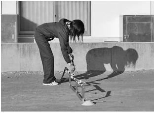
先生による事前準備

今回は、県中学駅伝で男女ともに優勝し全国大会にアベック出場した豊川東部中学校を訪問しました。5年前に男子が県代表になっていますが、今回は男女ともにの出場でした。顧問の先生方へのインタビュー、また目にした実際のトレーニングを通して見て取れた強さの要因を紙面の限り紹介します。