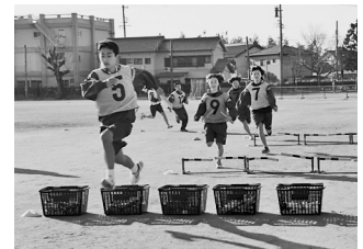
全体練習 (エンドレスリレー)