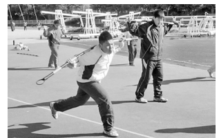
動きづくりにはげむハードルブロックと投てきブロック