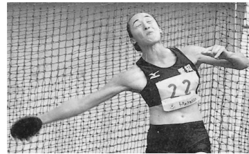
平成21年10月5日中日新聞より

新潟国体5日前、長年の競技生活で患っていた腰痛が発生。その時の状態をご報告するときはとても無念な気持ちでした。もしも大好きな国体に出場できなかったら…。そんなことが頭をよぎりました。幸いにもひどいケガではなかったために、トレーニングを中断し、痛みを取除くことに専念。試合で自分の持ち味が出せるか、不安もありましたが、どうにか出場に至り、優勝をすることができました。長年お世話になってきた地元への恩返しができることをとても幸せに感じ、感謝の気持ちでいっぱいでした。