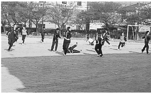
鬼ごっこによるアップ

今回は、女子の4×100mRで県中学新記録を塗り替え、48.68をマークした長良中学校を訪問しました。長良中学校は、昨年に引き続いて2年連続で県中学記録を塗り替えており、今年で女子の4×100mR県中総体3連覇となっています。こうした強さを誇る学校ですから、さぞかし環境の整った中で練習が積み重ねられているのだろうと思って訪問したのですが、予想は完全に裏切られました。グラウンドは狭く(トラックを書く余裕すらなく、短いカーブ区間を含めて直線コースが110mほど取れるだけ)、しかも砂浜かと思われるような劣悪な状態でした。そんな中で県中学新記録を出すからには、何か秘訣があるのだろうと思い、取材に入りました。