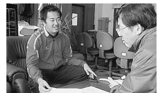
佐橋先生への取材