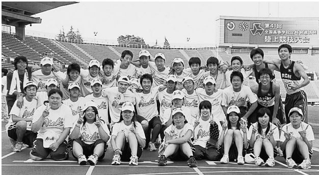
健闘した愛知県選手団