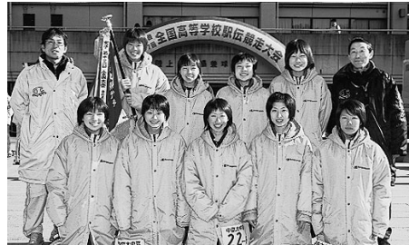
この「感激」と「体験」を次のステップと人生の糧に